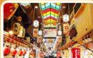
ตลาดปลาเนชิกิ