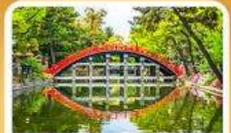
ศาลเจ้าสุมิโยชิ โทอะ