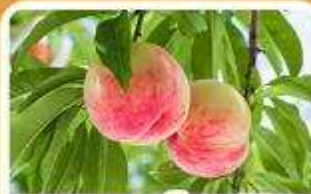
กิจกรรมเก็บผลไม้