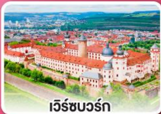
เวร์ซบวร์ก