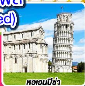
หออนปิซ่า