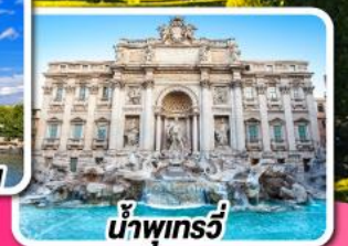
น้ำพุกรวี