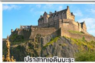
ปราสาทเอดินบะระ

เยือนสโตนเฮนจ์ และ พิพิธภัณฑน์โรมันโบราณ