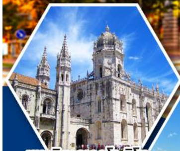
มหาวิหารเจโรนิโม