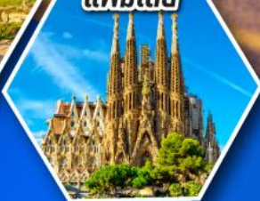
โบสถ์ซากราดา แฟมิเลีย