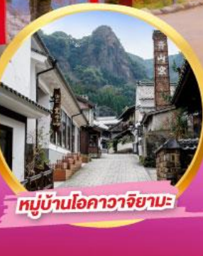
หมู่บ้านโอคาวาจิยามะ