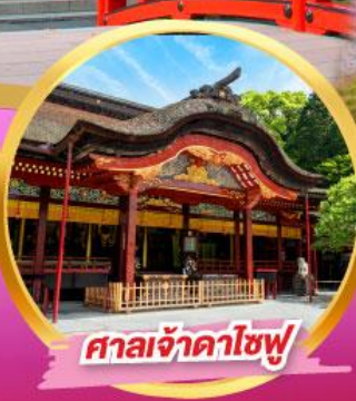
ศาลเจ้าดาไซฟุ