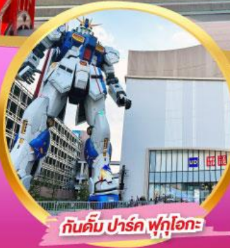
กันดั้ม ปาร์ค ฟุกุโอกะ