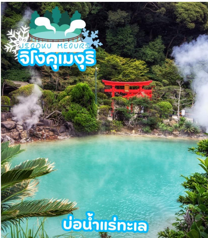
บ่อน้ำแร่ทะเล

ได้เวลาอันสมควรนำท่านเดินทางสู่ เมืองเบปปุ (Beppu) เมืองในจังหวัดโออิตะ (OITA) ตั้งอยู่บนชายฝั่งทะเลตะวันออกของเกาะคิวชู ประเทศญี่ปุ่น เป็นเมืองท่องเที่ยวแช่น้ำพุร้อนยอดนิยมของญี่ปุ่น จัดเป็นเมืองที่มีรีสอร์ทน้ำแร่มากที่สุด นักท่องเที่ยวนิยมมาแช่ออนเซนหรืออบทรายร้อนริมทะเลที่เมืองนี้