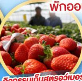
กิจกรรมเก็บสตอว์เบอร์รี่