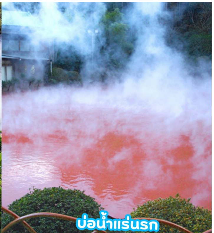
บ่อน้ำแร่รส