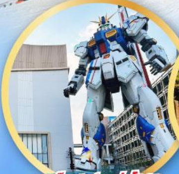
กันดั้ม ปาร์ค ฟุกุโอกะ

เดินทาง 09-13, 16-20, 23 -27 ม.ค.68 06-10, 13-17, 20-24 ก.พ. 68 07-10 มี.ค. 68