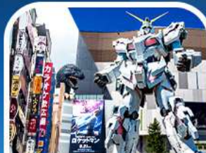
ช้อปปิ้งชินจูกุ+กันดั้มยักซ์