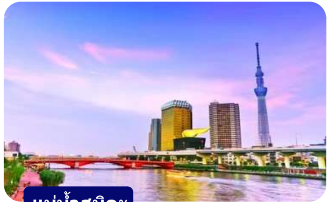
แม่น้ำสุมิดะ

ส่วนไฮไลท์สำคัญของวัดนี้คือ ไตคอน หรือหัวไข่เท้า สัญลักษณ์ศักดิ์สิทธิ์ คนที่นี่เชื่อว่าไตคอนช่วย "ชำระล้างสิ่งไม่ดี" และนำโชคลาภเข้ามา นักท่องเที่ยวมักนำไตคอนไปถวายเพื่อขอพร