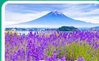
สวนโออิชิปาร์ค