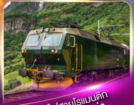
รถไฟสายโรเมนติก ฟลัมส์บาน่า