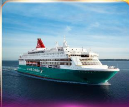
เรือสำราญ GO NORDIC CRUISE LINE