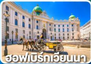
ฮอฟบวร์กเวียนนา