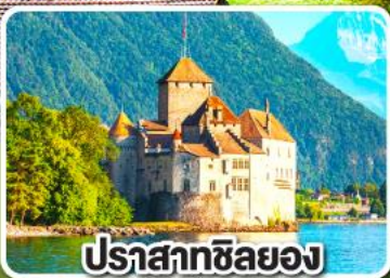
ปราสาทชิลยอง